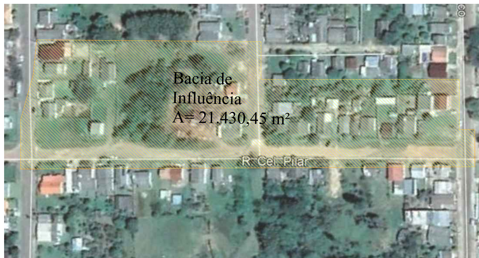
DELIMITAÇÃO DE BACIA - RUA CORONEL PILAR Área da Bacia de Contribuição: 21.430,45 m 2