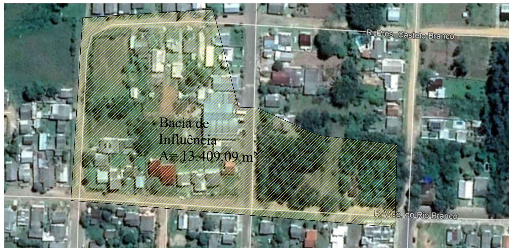
DELIMITAÇÃO DAS BACIAS - RUA VISCONDE DO RIO BRANCO Área da Bacia de Contribuição: 13.409,09 m 2